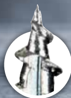
EXTRA SCHERPE PUNT