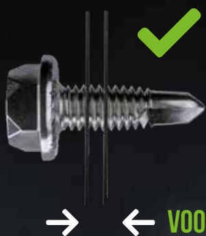
← → VOORBEELD 1

professionele bevestigingen en gereedschappen